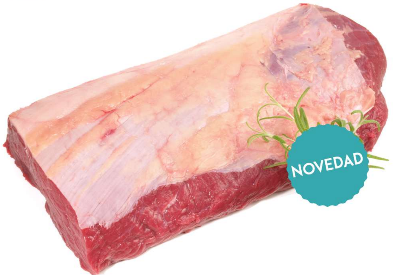
LOMO BAJO ENTERO +5 Kg 2 ud/caja

Por la compra de la CAJA COMPLETA de 2 ud