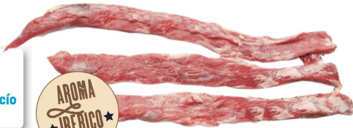
LAGARTO SABOR IBÉRICO Caja de +/- 5 Kg al vacío 120 gr/ud aprox