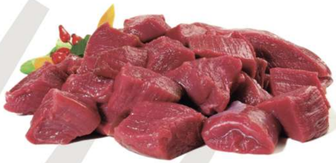
RAGOUT DE CIERVO Caja de 5 Kg