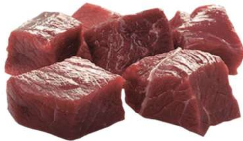
RAGOUT DE TORO Caja de 5 Kg