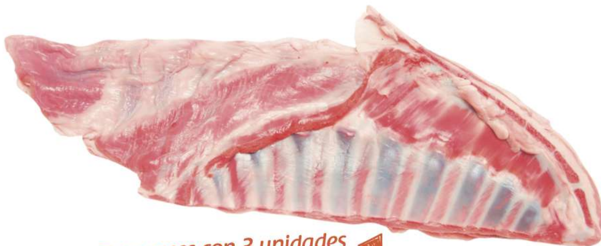
FALDA DE CORDERO Caja de +/- 5 Kg