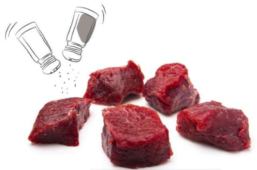
RAGOUT DE JABALÍ Caja de 5 Kg