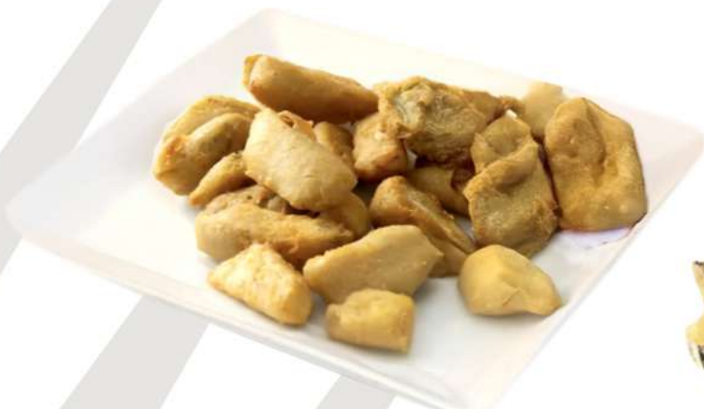
ALCACHOFA REBOZADA 6 bolsas de 500 gr 40-50 ud/Kg aprox.