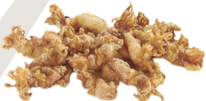
PUNTILLA ENHARINADA Caja de 2 Kg 90-150 uds/Kg