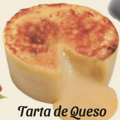
Tarta de Queso Caja de 27 ud de 100 gr