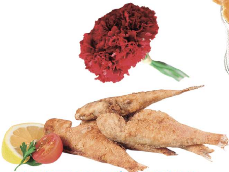
SALMONETE DE SANLÚCAR HARINADO Caja de 4 Kg 29 uds de 35 gr aprox/Kg