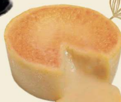
Chocolate blanco Caja de 18 ud de 90 gr