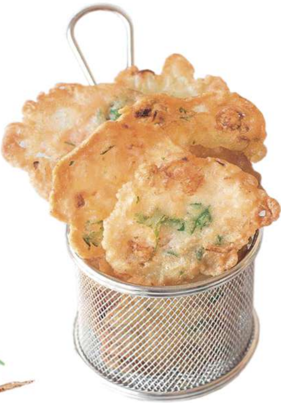
TORTILLITA DE CAMARÓN DE CÁDIZ 48 uds de 50 gr