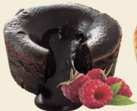
Chocolate francés Caja de 27 ud de 110 gr