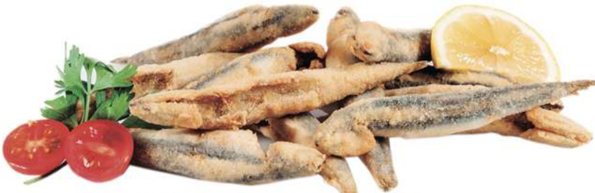
BOQUERÓN ENHARINADO Caja de 4 Kg 55 uds de 20 gr/ud