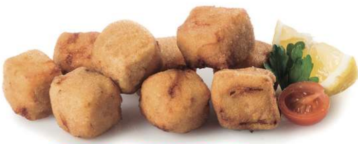
ADOBO ENHARINADO Caja de 5 Kg 60 uds de 17 gr/ud