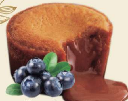
Turrón Caja de 27 ud de 100 gr