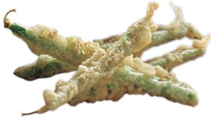
GUINDILLAS REBOZADAS Caja de 2 bolsas de 1 Kg 250 uds/Kg