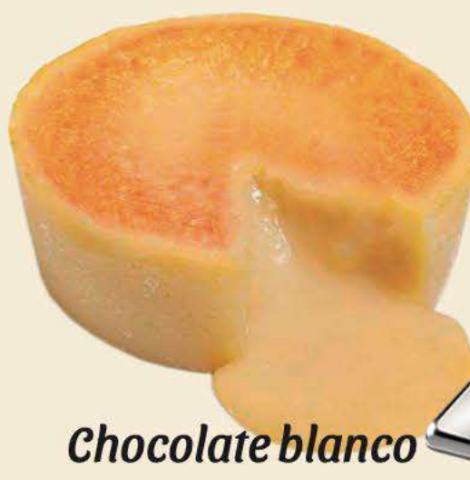
Chocolate blanco Caja de 18 ud de 90 gr