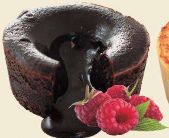
Chocolate francés Caja de 27 ud de 110 gr