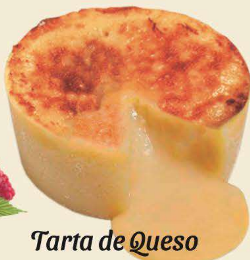
Tarta de Queso Caja de 27 ud de 100 gr