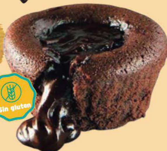
Chocolate sin gluten Caja de 18 ud de 120 gr