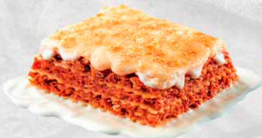
LASAÑA BOLETUS S/BECHAMEL 30 x 160 gr